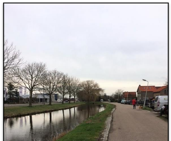
Nu links het industrieterrein Molletjesveer