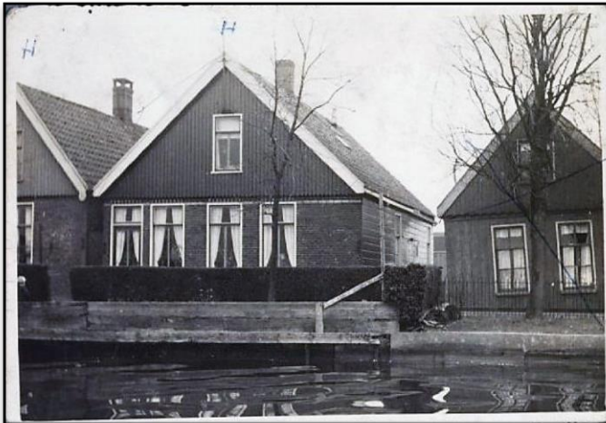
Het oudste stukje van Westknollendam toen, richting het Zwaantje