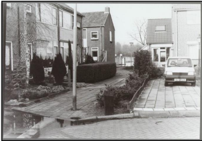
Bakkersstraat richting de Tap-sloot