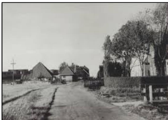
Links de boerderij van boer Woud en rechts daarvan het PEN huisje