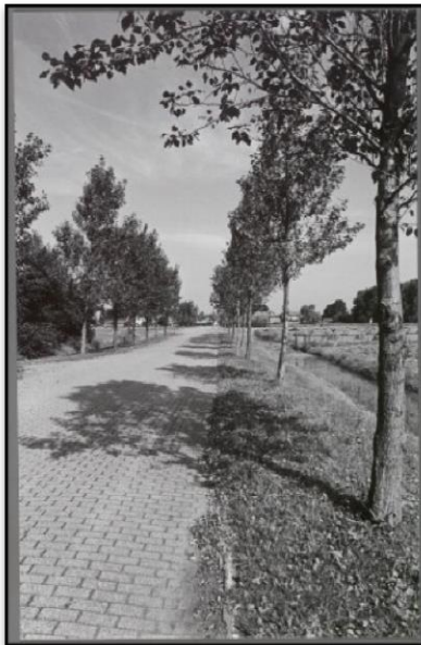
Piet Kuyperlaan met rechts de Theo Thijssenschool