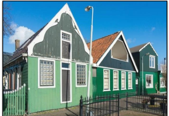
Deze huizen staan er nog steeds maar dan verbouwd