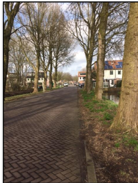
Nu alle weilanden bebouwd met een-gezinshoningen