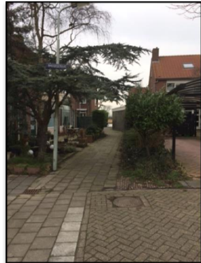
nu ... 2017