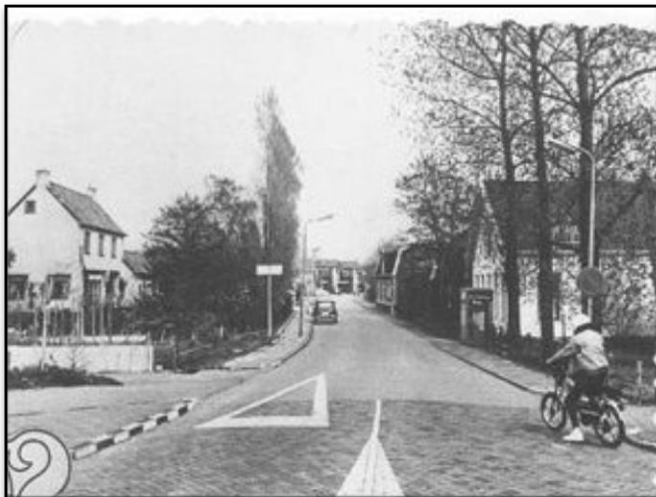
Toen nog via de kruising het dorp in rijden (rechts nog de telefooncel)