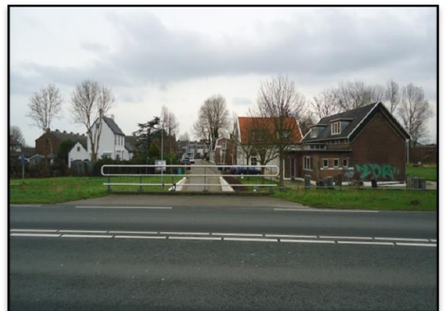
Sinds 1995 ligt er een fiets-voetgangerstunnel onder de N246